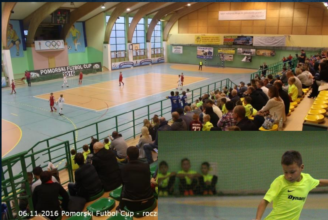
06.11.2016 Pomorski Futbol Cup - rocz