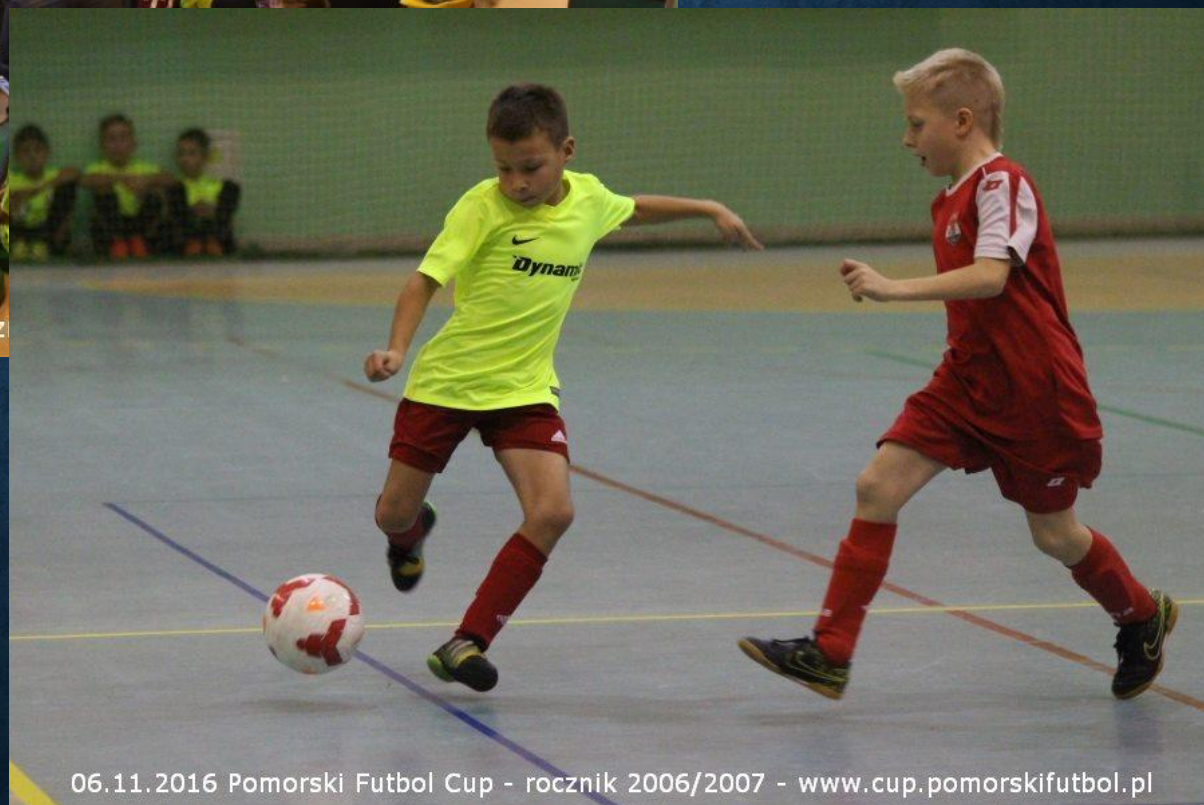
06.11.2016 Pomorski Futbol Cup - rocznik 2006/2007 - www.cup.pomorskifutbol.pl