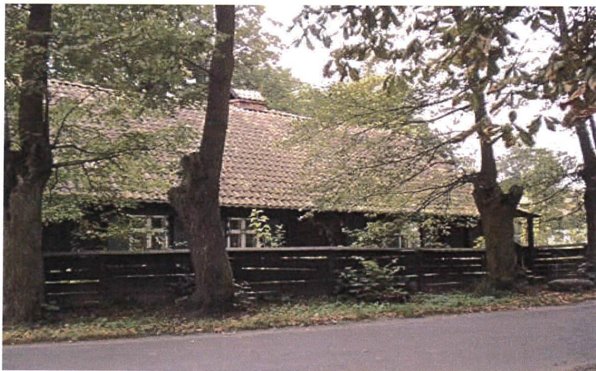
Charakterystyczna zabudowa Warmińska