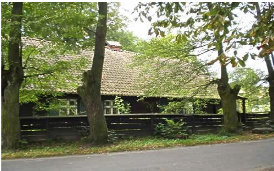
Charakterystyczna zabudowa Warmińska