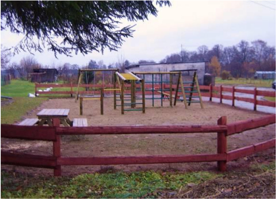
Plac zabaw w Krupolinach