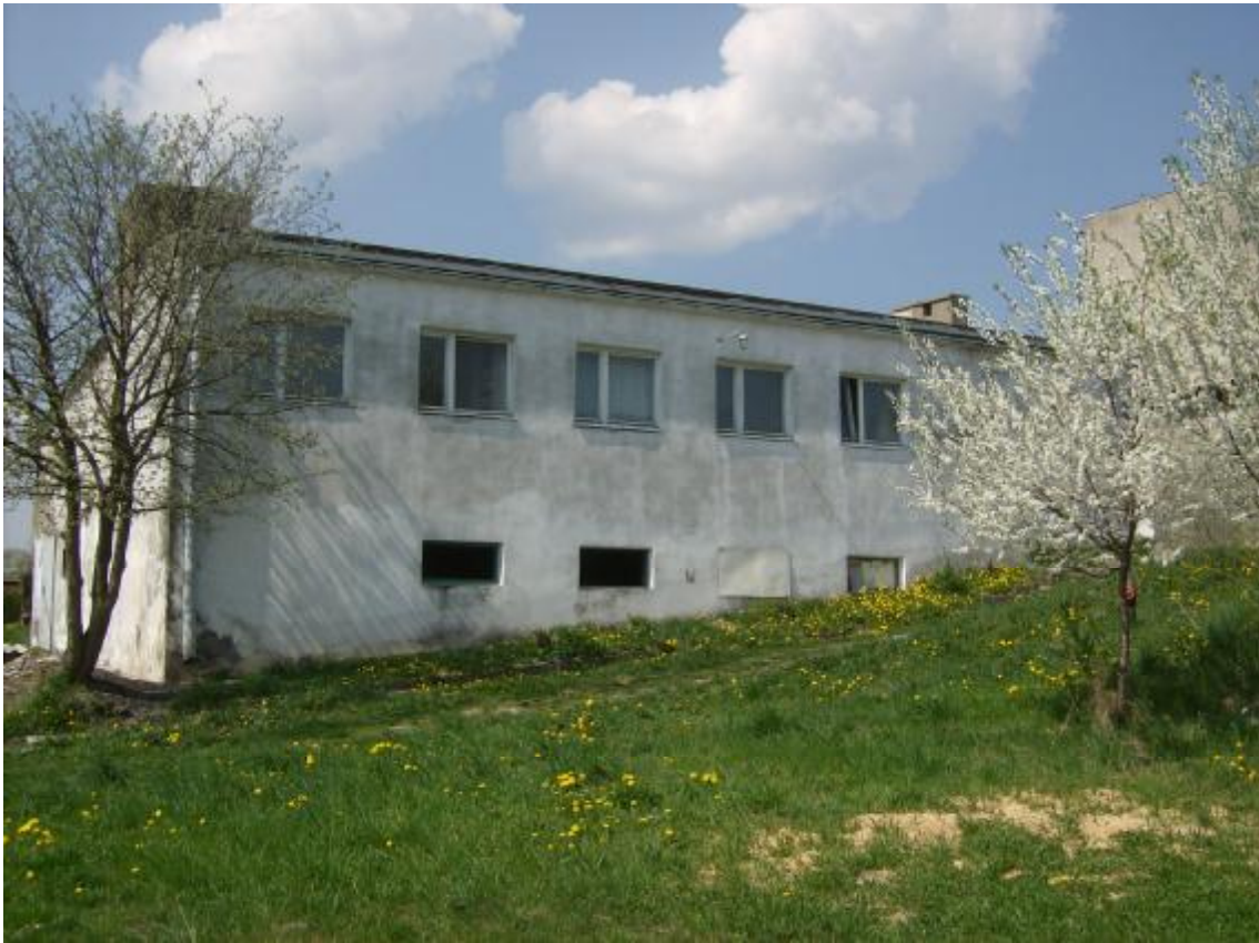
Budynek po bylej kotłowni w Niedźwiedziu