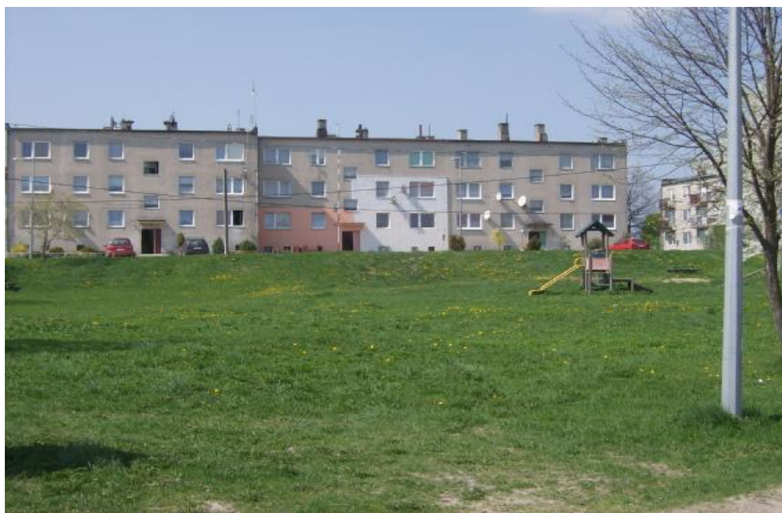
Plac zabaw w Niedźwiedziu