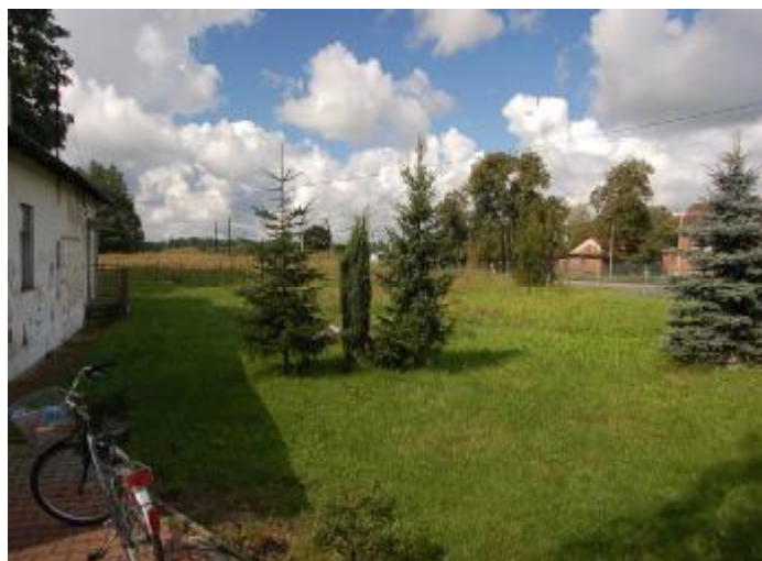
Świetlica wiejska oraz plac wokół świetlicy w Wipsowie