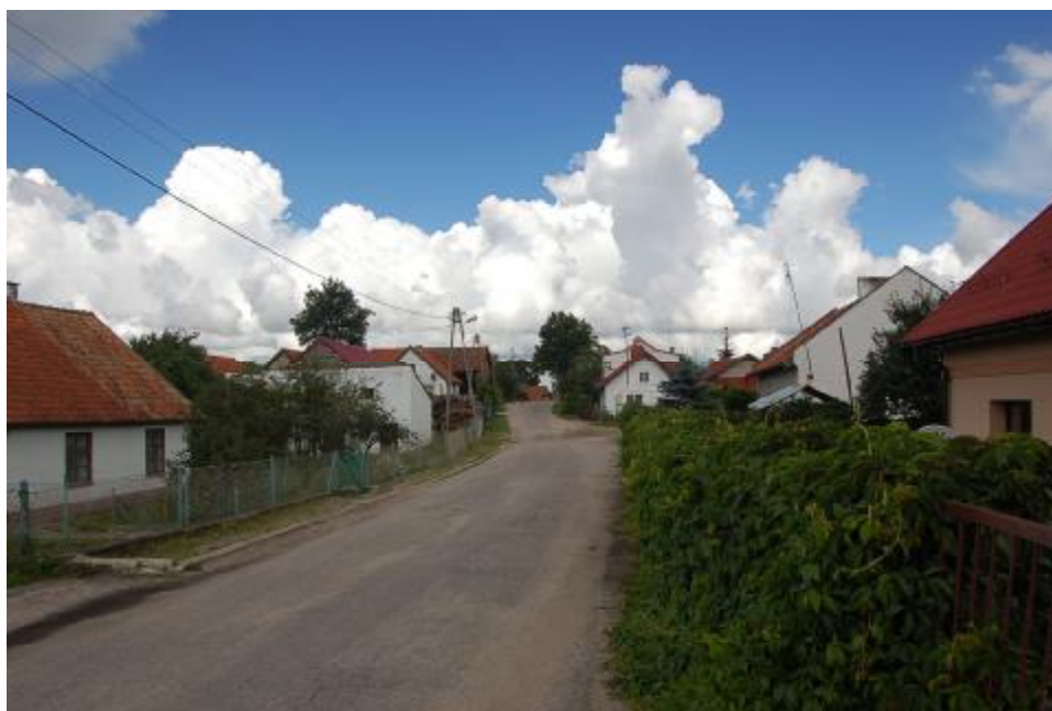
Wiejska zabudowa Wipsowa