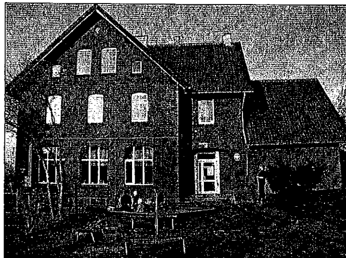
Niepubliczny Zespół Szkół i Placówek w Kronowie