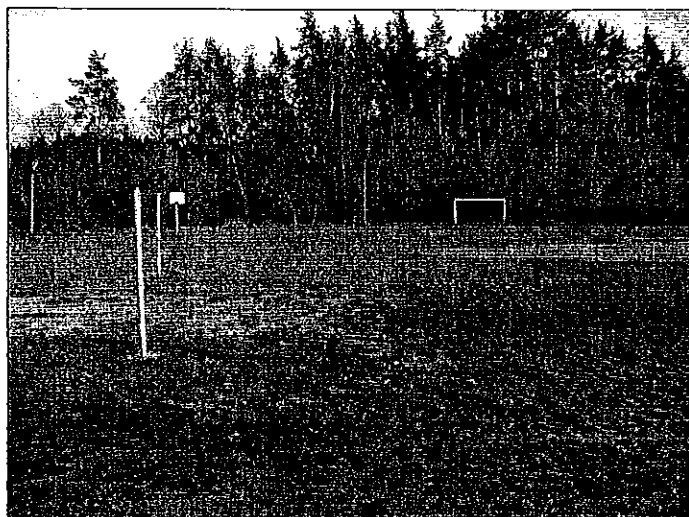
Boisko wiejskie w Kronowie