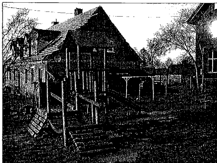
Plac zabaw przy boisku w Kronowie